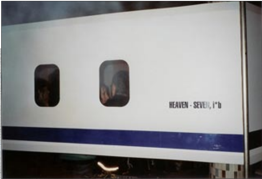
LUV - aussen und innen